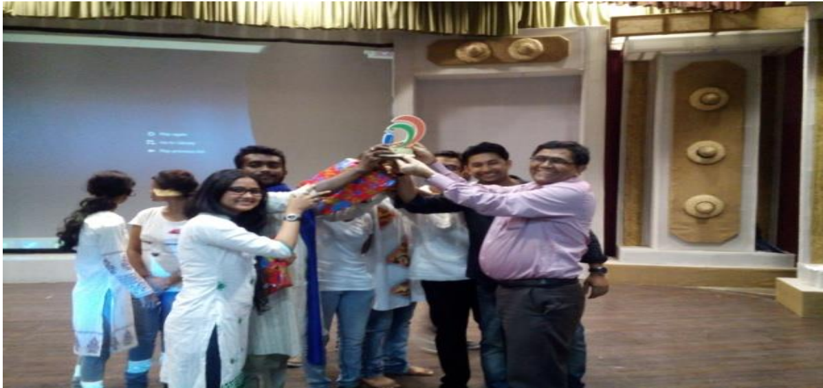
1 st Position of Drama team staged an drama to generate awareness on e-learning