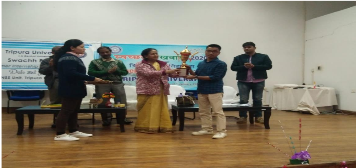
Swachha Bharat Summer Internship Award