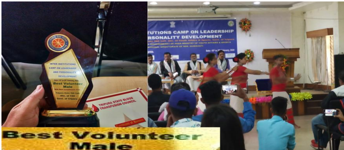
Inter Institutions Camp on Personality and Leadership Development