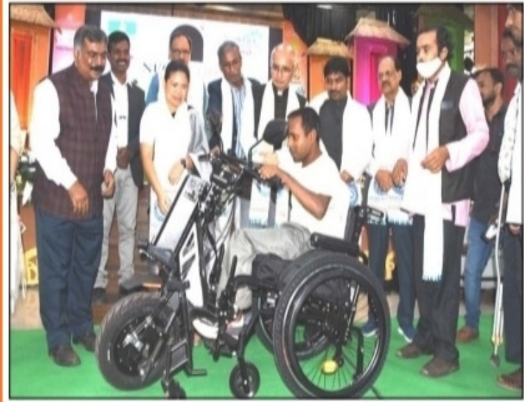
বিশ্ববিদ্যালয়ে দিব্যাদজন নিয়ে আলোচনা সভা। শনিবার।