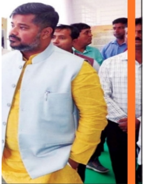
...y inaugurated a three-day ph... ...lege, Lembucherra on Wednesday.